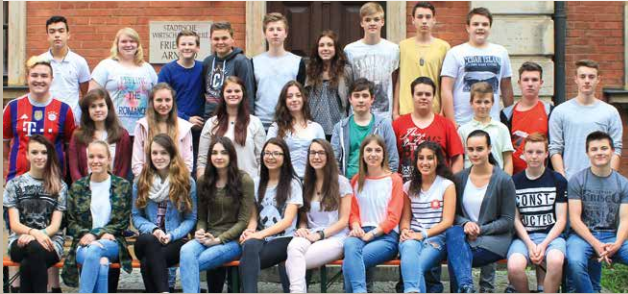
HERRSCHAFTEN! Städtische Wirtschaftsschule Friedrich Arnold Amberg