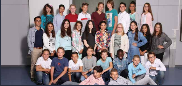
DIE AUTOREN DER KLASSE 7 C DER JOHANN-PETER-HEBEL-REALSCHULE WAGHÄUSEL