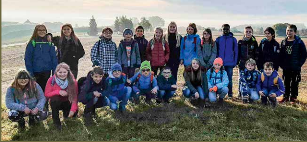
Jam-Projektgruppe der Stufen 5/6 der Sonnenlagerschule Mengen