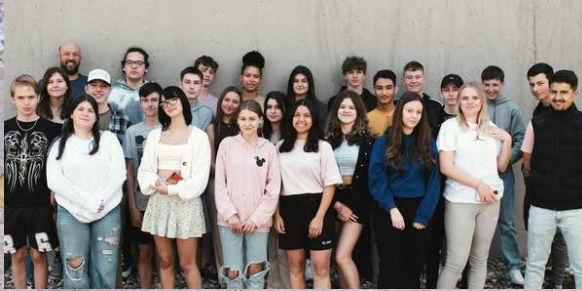
Schüler der Klasse 9a der Willy-Brandt-Realschule in Königsbach